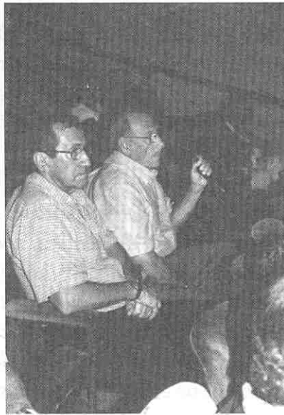
Interesantes preguntas formuladas por el público asistente